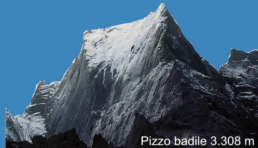
Pizzo badile 3.308 m

conquistato da Riccardo Cassin nel 1937 insieme a 4 compagni, 2 dei quali persero la vita dopo 3 giorni di fatiche con pioggia, temporali, grandine, e neve.