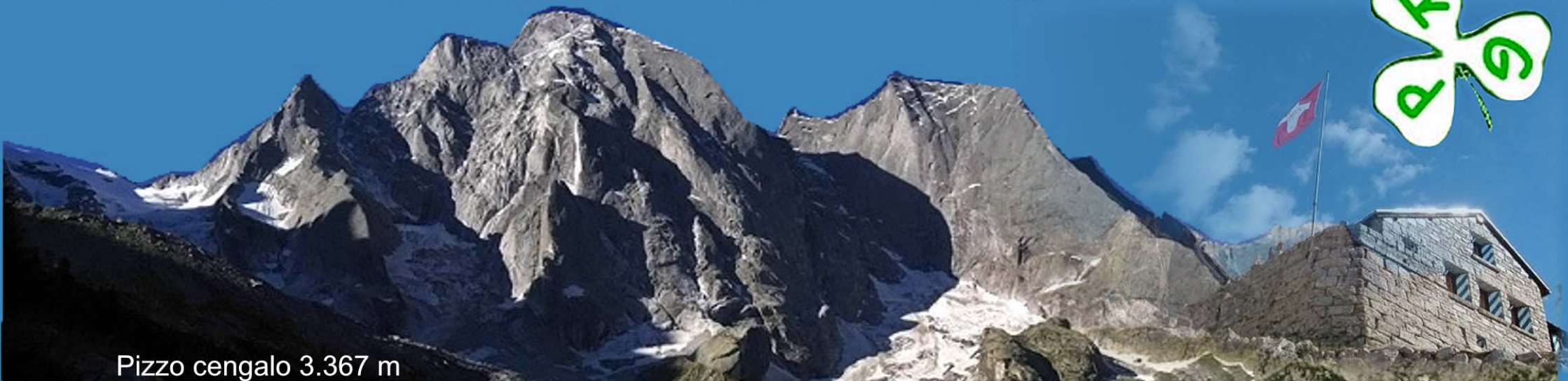
Pizzo cengalo 3.367 m

Da Chiavenna si raggiunge il confine con la Svizzera. Dopo 3 Km si raggiunge Bondo 823 m e si prosegue in macchina lungo la strada sterrata ben tenuta che si addentra nella val Bondasca, pagando un pedaggio di 10 euro. Si raggiunge il parcheggio a 1300 da dove parte il sentiero. Inizia qui un affascinante e non poco faticosa camminata che in 2,5 ore ci condurrà allo Sciora. Seguiamo la sponda sinistra del torrente fino ad un bivio con panchina e cartelli indicatori, lasciamo a destra la traccia per Sasc Fourà continuiamo dritti sbucando poco dopo nel pianoro erboso dell'Alpe Laret. Da qui si costeggia, in leggera salita, il greto del torrente finché la traccia devia a sinistra con una ripidissima serie di tornanti e si raggiunge l'Alpe Eraveder (1843 m). Da qui si gode uno splendido panorama di tutta la testata della valle. Particolarmente notevole è la vista sulle pareti del Cengalo e del Badile (incantevole granito roccioso ambito da molti alpinisti mondiali). Traversato il magro pascolo, la salita prosegue un po' più dolce e, con un lungo diagonale fra ontani e blocchi porta ai pascoli sassosi sottostanti il Rifugio Sciora 2118 m.